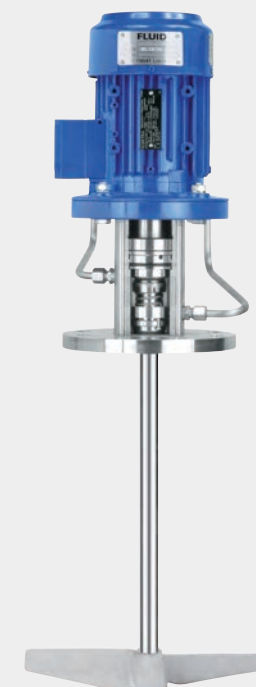
FGL – Für kleine Volumina