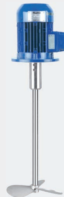
MD – Allrounder