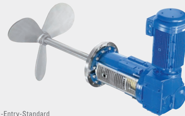
ES 2000 – Der Side-Entry-Standard