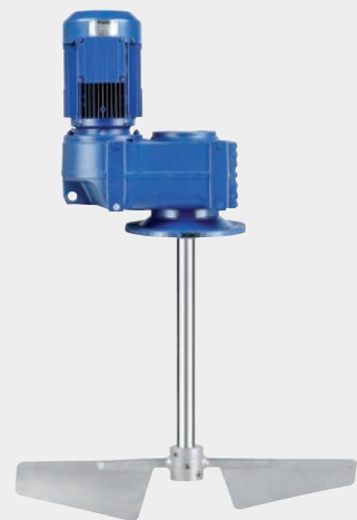
FD – Das robuste Rührwerk