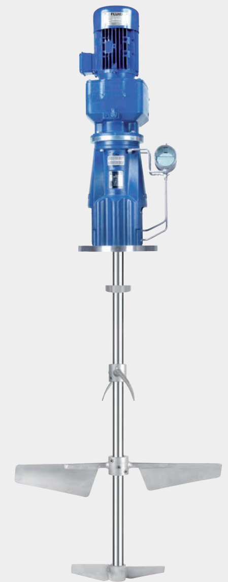
EM2000 – Das Industrierührwerk