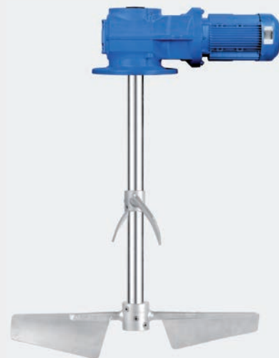
KD – Allrounder